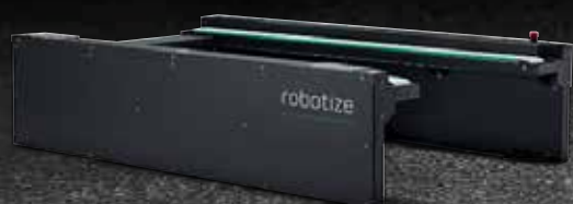
GOPAL KONVEIERIGA KAUBAALUSTE JAAM

Lahendusesse saab integreerida kutsunginupud (call buttons) roboti tellimiseks kaubaaluste jaamast sõltumatult.