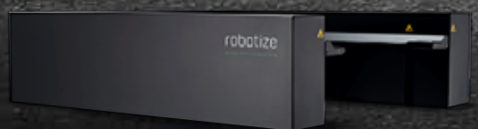
GOPAL TÕSTUKIGA KAUBAALUSTE JAAM